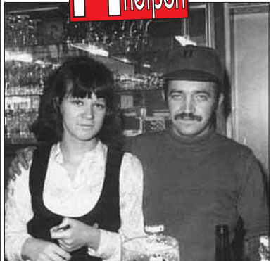
Pit in den Anfangszeit im „Töff Töff“, ca. 1970.

Die Getränkekarte an der Wand - auch für den kleinen Geldbeutel ist ganz unten etwas dabei.